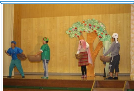
【4年：世界一美しいぼくの村】