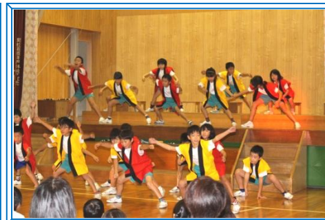
【3年：おいしい給食で元気パワー全開】