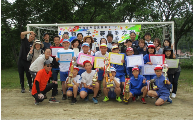
6年生のおかげで、すてきな運動会になりました。