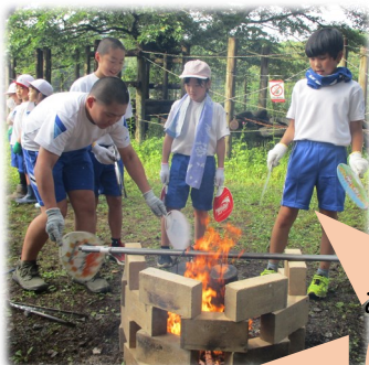
みんなで役割を分担し、ファイヤーの準備、カレーライス作りを行いました。