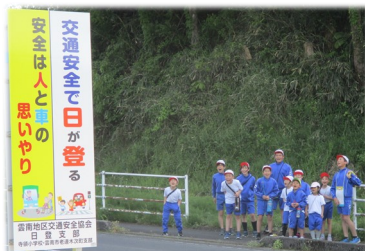
ウォークラリーでは、交通安全の看板や國玉神社などをまわりました。