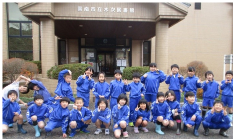
1年生は郵便局、2年生は木次図書館でお世話になりました。