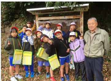
4年生は、オロチ伝説ツアー、真金の井関見学など、地域を知る活動ががんばりました。

学校の外へ出かける活動もたくさんありました。多くの皆様に支えられながら、心に残る、充実した活動にさせていただきました。この場を借りて、感謝申し上げます。