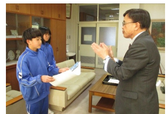
2学期も、寺領っ子は校内外で大活躍でした！