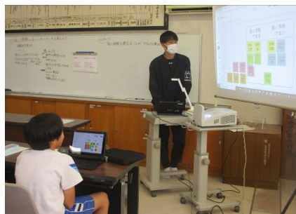
学年ごとに「デジタルシティズンシップ」について学びました。冬休みは、タブレット端末などにふれる機会が増えると思います。学んだことを生かし、上手に使ってください。