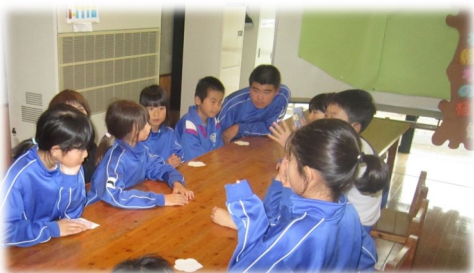
みんなが優しい気持ちになれる人権集会でした。