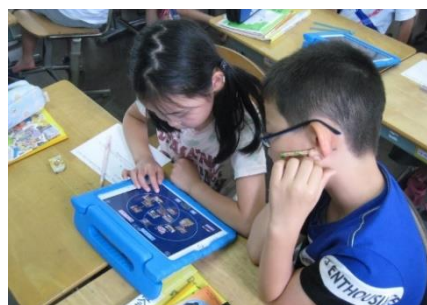
児童用タブレットを使った学習