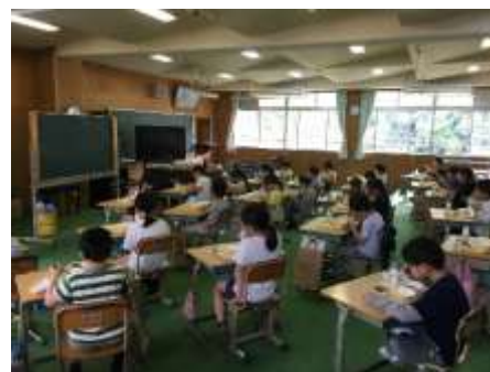
広い音楽室を使った授業や給食

学校は再開しましたが、新型コロナウイルスが収束していない現状のなかで、三密（密集、密閉、密接）を避けるため、座席を離す、換気を十分にする、感染リスクが高い学習内容を変更するなどの感染症対策を、これまで通り継続して行う必要があります。一クラスあたりの人数が多い3年生、4年生、5年生は、教室内での座席が他の学年よりも密接しており、密接を避けるために、音楽室などの広い特別教室を活用したり、一クラスを二つの教室に分けて授業を行ったりするなどの対策もとっています。また、マスクを外す場面（給食や歯みがきなど）では、よりリスクが高まることから、給食を食べる場所を分けたり、歯みがき場所が混雑しないようにしたりするなどの工夫もしています。コロナが身近にあるという前提で、今後の感染状況の推移も踏まえながら、子どもたちの安全や健康のために取り組んでいけたらと考えています。