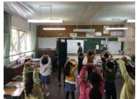
オンライン朝の会・帰りの会

本校のようなオンラインでの朝の会や帰りの会を実施した学校は、島根県内でもめずらしいと思います。家庭のICT環境が一律ではないなかで、学校としてこのような試みをするのに対して、実施をためらう学校が多いからだと思います。実際、すべての子どもたちに参加していただくことができないなかでの実施となったことには、申し訳ない思いもあります。ただ、文部科学省も、ICTやオンラインの活用について、一律でなくとも、できることから取り組んでいくことを積極的に奨励しています。（右の説明資料参照）学校としては、参加できなかった子どもたちにも、今回の取組を還元していけるよう、ICTやオンラインを活用した取組に、引き続きチャレンジしていきたいと考えています。