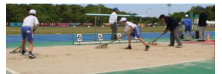
補助役員も一生懸命!