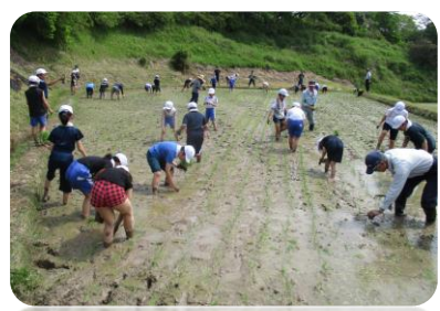
5年生田植え 5月16日(木)