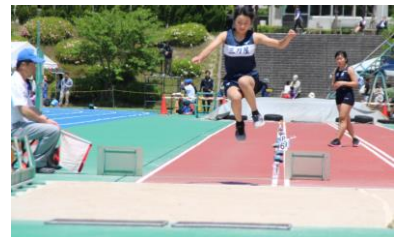
好ジャンプ! 惜しくも2位