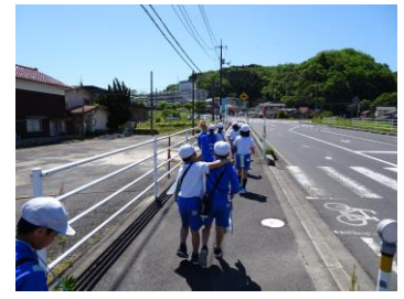
3年生 町見学 5/7

3年生は、グループで3コースに分かれて町見学に行きました。下熊谷・地王・中学校方面へ