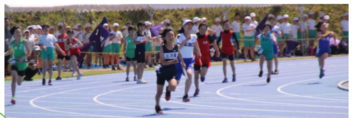
見ごたえのあるアンカー勝負!