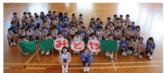
壮行式は、4年生が立派にかっこよく行いました