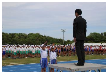
三刀屋小が選手宣誓