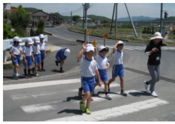
1・2年生 交通安全教室