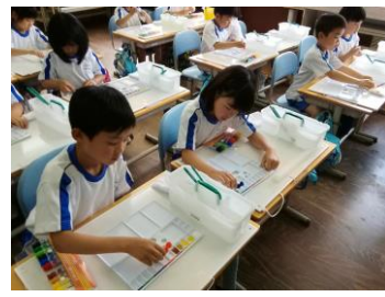
1年生 初めての絵の具