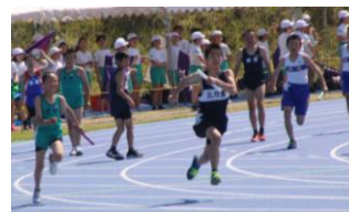
完璧なバトンパス!