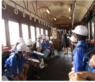
2年生は一畑電車初乗り！ 10/30