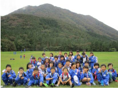
1年生は三瓶で秋見つけ 10/21