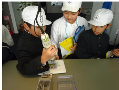
5年生は富士通見学 11/8