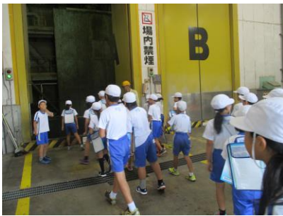
4年生はササキセンターへ 10/1