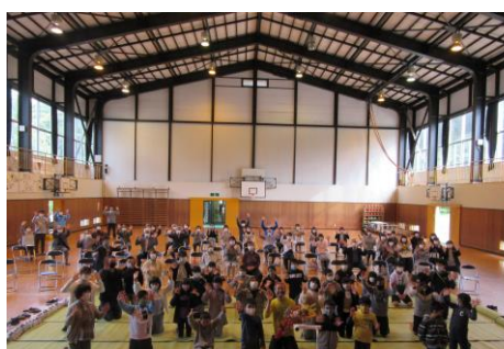
PTA 研修会・愛の共育講演会の後の記念撮影です。

最後になりましたが、2学期も終わりに近づきました。今年度もコロナ禍の中において感染予防に気を付けながら、予定しておりました教育活動をすべて実施できたことは幸いでした。