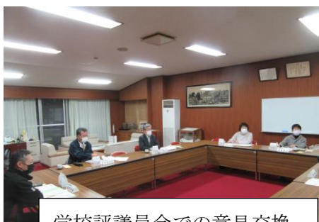
学校評議員会での意見交換

2月8日(火)に第3回学校評議員会を行いました。ここでは、事前にお配りした学校評価結果と今後の学校の取組案をもとに、今年度1年間の学校経営についてご意見を頂戴しました。