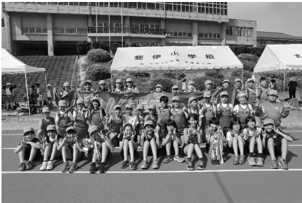
写真：みんなで記念撮影

5月9日（木）、ふれあい運動公園陸上競技場で、第15回雲南市小学校陸上競技大会が開催されました。5年生と6年生が参加しました。