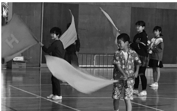
写真：旗を振って応援だ！

お弁当を作ったり、励ましの声をかけたりしてくださった家族の皆様、応援に来ていただいた地域や保護者の皆様、ありがとうございました。