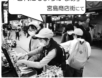
「どれにしようかなあ」 宮島商店街にて