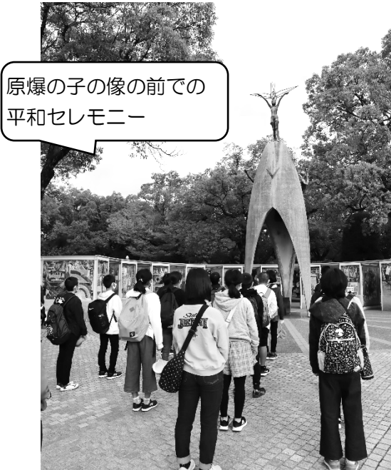
原爆の子の像の前での 平和セレモニー