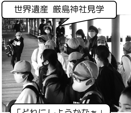
世界遺産 厳島神社見学