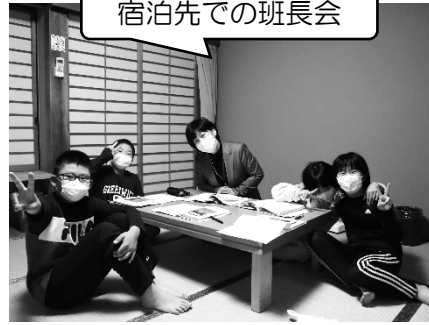
宿泊先での班長会