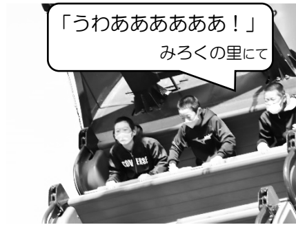
「うわあああああ！」 みろくの里にて

11月10日(火)、11日(水)の2日間で6年生が修学旅行に出かけました。コロナ禍のため、バス乗車中もマスク着用、行く先々で手指消毒、ソーシャルディスタンスを保つための食事、定期的な検温など、しっかりと感染症対策を取った旅行となりました。