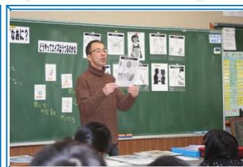
【6年：エイズについて】