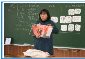
【2年：おへそのひみつ】