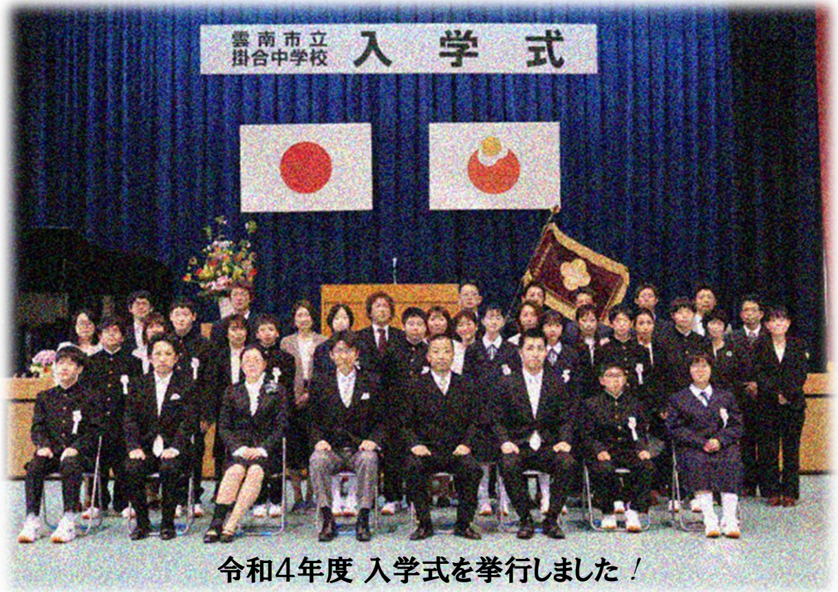
令和4年度 入学式を挙行しました！

令和4年度がスタートしました。生徒の皆さんのより良い成長のために、「地域とともにある学校づくり」を一層推進していきたいと思ひます。保護者の皆様、地域の皆様どうぞよろしくお願ひします。