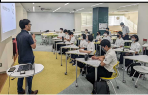
徳島大学(株式会社グリラス)