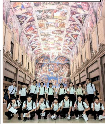
鷲羽山ハイランド(岡山県)