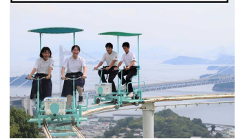
鷲羽山ハイランド(岡山県)