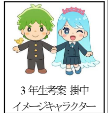
3年生考案 掛中 イメージキャラクター

先日は、「掛合まちおこし大作戦～掛合の虜にしちゃいます～」イベントにお越しいただきありがとうございました。来場者の皆様は、私たち一人ひとりに温かい言葉をかけてくださったので、その言葉に励まされるとともに、嬉しい気持ちでいっぱいになりました。かけがえのない時間を過ごすことができたことに、感謝の気持ちでいっぱいです。私たち3年生は、あと半年で中学校を卒業します。最後まで頑張る私たちの姿をこれからも近くで応援していただけたら幸いです。これから肌寒い季節を迎えますが、お体には気をつけてお過ごしください。ありがとうございました。