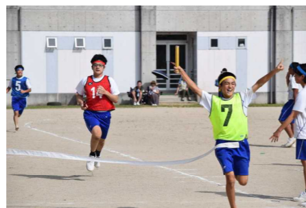
色別選手リレー、最後まで全力で駆け抜けました