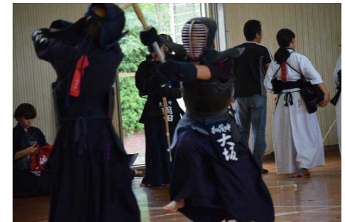
果敢に面を打ち込む選手