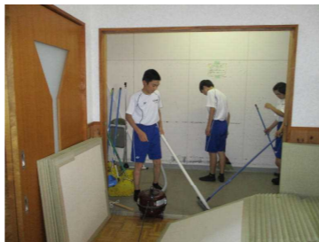
全校奉仕活動（加茂交流センター）