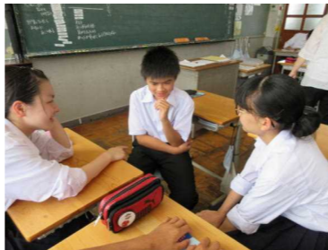
道徳でのグループによる話し合い

○全国平均と比べて低い結果の項目（10ポイント以上肯定的回答が下回っているもの）