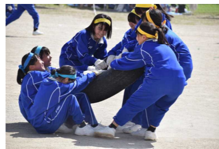
女の合戦（タイヤ引き）は見て いる方も力が入る競技でした