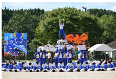
マスゲーム最後の演技の塔 しっかりときまりました

会場を華やかに飾ったデコレーション 右より赤組、青組、黄組 ホームページではカラーで見ることができません