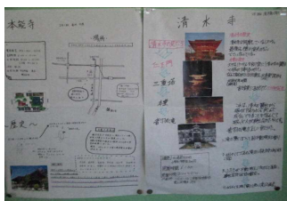
パソコンでの調べ学習の様子とまとめのプリント(下)

また、2月は接遇研修を行いマナーや礼儀などの大切さを学んだり、実技を行ったりします。