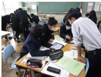
班ごとにタブレットで松江について調べています

○1年生は3月実施予定の松江自主研修に向けて、見学地調べや移動方法、昼食場所などの話し合いを行っています。班ごとに、ガイドマップや地図で調べたり、タブレットでホームページを検索したりして調べ学習を進めています。この松江自主研修は修学旅行で行う京都一日自主研修に活かされます。