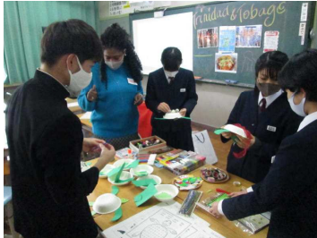
トリニダード・トバコのコーナーで創作活動をする3年生

2, 3年生対象のイングリッシュデイを1月21日(木)に行いました。市内のALT、国際交流員4名が加茂中に来校され、2, 3年生と交流しました。2年生は学級ごとに4人の出身国や住んでいた国(合衆国、カナダ、ロシア、トリニダード・トバコ)の紹介やそれに関するクイズを行い、3年生はワークショップ形式で、4カ所に分かれてゲームや創作活動などで楽しみました。この時間は英語のみでの会話でしたが、生徒は話の内容を理解し、楽しそうに活動をしていました。