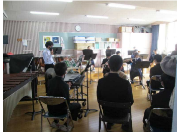
部活動見学をする児童のみなさん（手前）

新入生一日入学を2月6日（土）に行いました。校舎見学（児童）、物品購入説明（保護者）の後、全体会を行いました。全体会では校長のあいさつに続いて、生徒会本部役員（生徒会正副会長）が生徒会活動や学校行事、部活動など加茂中学校を紹介するプレゼンテーションを行いました。生徒会長は「中学生生活が充実したものになることを祈っています。みなさんのご入学を楽しみにしています。」と呼びかけました。その後、中学校での学習や生活などの説明を聞き、物品注文や制服等の採寸、部活動見学をして終了しました。児童の皆さんのご入学をお待ちしています。