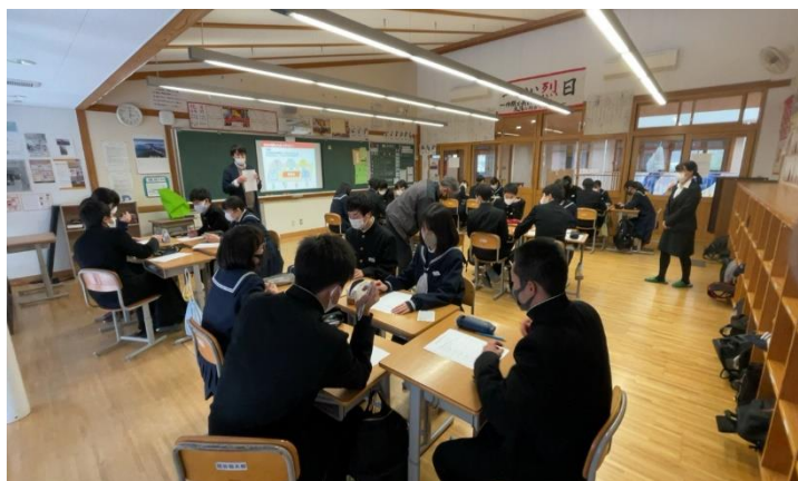
【3年1組の授業の様子】

また、学習カードを使って納税や歳出を通じて所得格差の拡大を抑制する(所得を再分配する)働きについて考えました。