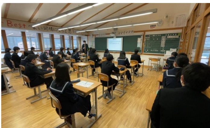
【3年2組の授業の様子】