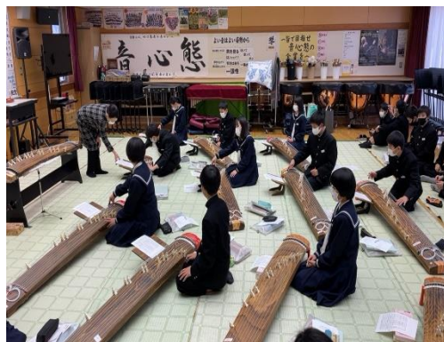
【真剣な表情で取り組む生徒】

各学級とも2時間ずつの授業でしたが、生徒は正座で背筋を伸ばし、一つ一つの音をしっかりと指で弾くことで、体を通して音の響きや余韻を実感できたのではないのでしょうか。春の陽気にサクラメロディー何ともゆったりとした穏やかな時間が流れる3日間でした。