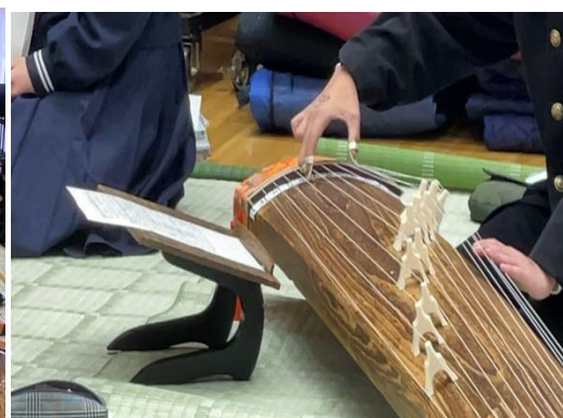
【箏(絃の下に柱を立てる)】