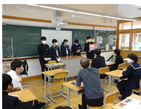
【島根県のPRをする2年生】