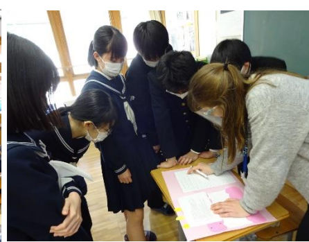
【ワークショップをする3年生】

※本校のホームページ随時更新中!ぜひご覧ください! http://shimane-school.nt/unnan/mitoya-chu/