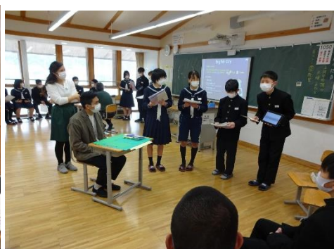
【タブレットで説明する2年生】