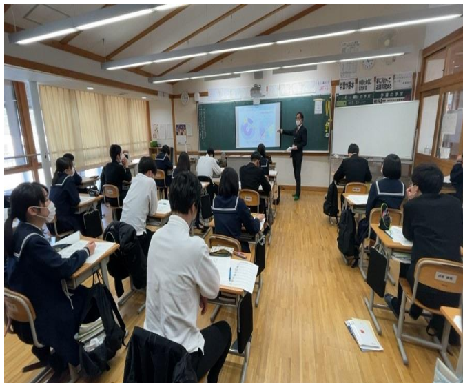
【真剣に話を聞く3年生】

1月26日(水)に雲南市税務課の方にお越しいただき3年生を対象に租税教室を行いました。授業の導入部分では「宝くじを買ったら、1億円が当たりました。この当選金に税金がかかるのでしょうか。」などクイズ形式から始まり、「税金の種類と分類」、「人生と税金」、「公立学校児童生徒一人当たりの教育費の負担額」、「雲南市の一般会計歳入、歳出額の内訳」など授業が進むに従って税金が身近に使われていることを学びました。今年の4月1日から成年年齢は20歳から18歳に引き下げになります。つまり、中学3年生は3年後には成人となり投票権を持つことになります。今後、中学校においても「社会で起きている出来事について自ら考え、主体的に行動できる人間を育成する」主権者教育はますます必要になってくると思いますので、ご家庭でも環境問題や福祉、税金の使い方、選挙等について話題にしてみてください。