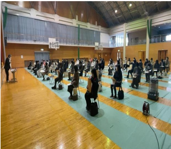
【入学説明会の様子】

1月28日(金)に入学説明会を実施しました。例年なら6年生と保護者の方に来ていただき、6年生には中学生の授業の様子や部活動見学を行う予定でしたが、オミクロン株の感染拡大、まん延防止等重点措置が発令されていることを考慮し、保護者の方のみ参加という形を取らせていただきました。急な変更には大変迷惑をおかけしました。