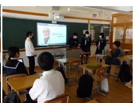
【宮崎駿を紹介する3年生】