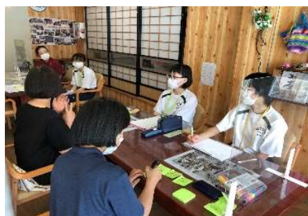
【訪問看護ステーションコミケア】