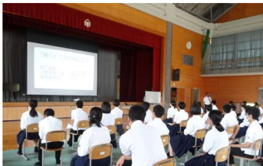
【真剣に話を聞く生徒】

研修では、職場体験学習で実践してほしいこと、社会から求められる能力や身だしなみ、相手の話を聞くことと書くことはセットであること等、職場体験学習の事前指導だけではなく、一人一人の進路選択や生き方につながるお話をして頂きました。