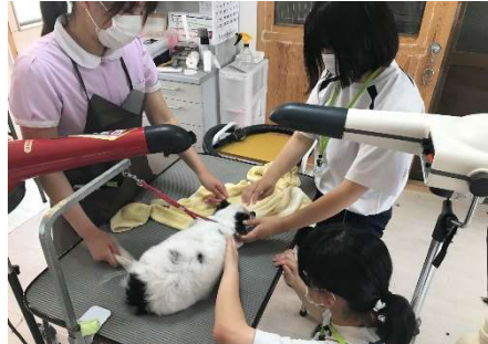
【さくら通り動物病院】