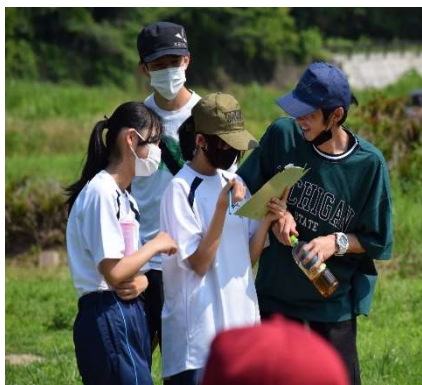
【親子の楽しいひととき】

6月19日(日)にPTAの学年委員さんを中心にして親子ふれあい活動(グランドゴルフ)を「うんなん家庭の日」に行ないました。