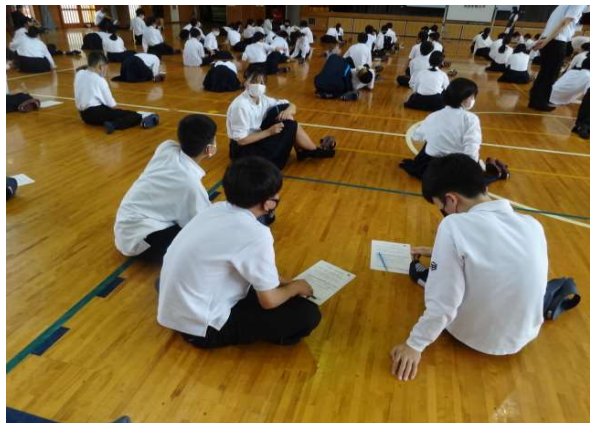
【北浦さんの質問に話し合う生徒】