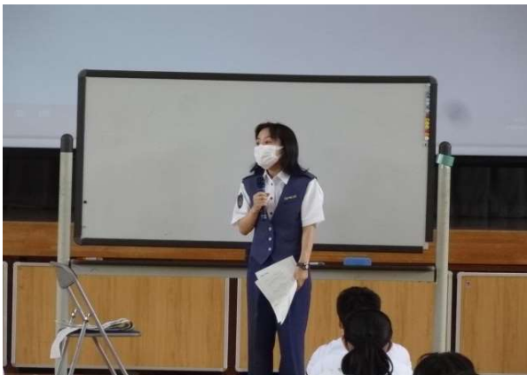
【ネットの現状について語る北浦さん】

SNSで知り合った人などに、裸の写真を自撮りして送信させたり、自分のスマートフォンのカメラで友達の裸の写真を撮影すると犯罪の加害者になること、オンラインゲームでの課金や誹謗中傷行為は犯罪行為になるので気をつけてほしいなどネットの利用の注意点を説明していただきました。小学校1年生から一人一台のタブレット端末を持つ時代になり便利な反面、危険性も持っています。今一度、ご家庭で使い方のルール等の確認をお願いします。