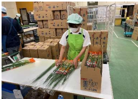
【県農業協同組合雲南地区本部】

7月6日(水)～8日(金)に職場体験学習を実施しました。本来ならば、10月に行なう『夢』発見ウィークですが、学校行事の関係で今年度は7月に行なうことにしました。新型コロナウイルス感染症が拡大する中、事業所の方に受け入れてもらえるか、無事に実施することができるか心配しましたが、事業所の方が温かく受け入れていただき生徒は貴重な体験をすることができました。昨年度は30の事業所のご協力いただきましたが、今年は昨年を上回る40の事業所に受け入れを承諾していただき本当にありがとうございました。残念ながら、承諾していただいた全ての事業所に生徒を行かせることができず申し訳ありませんでした。生徒は、この体験を自分の進路選択に生かしてほしいと思います。(今年度、新規の事業所さんでの体験の様子：敬称略)