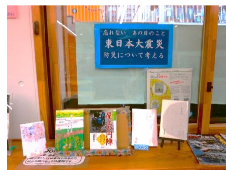
忘れない あの日のこと 東日本大震災