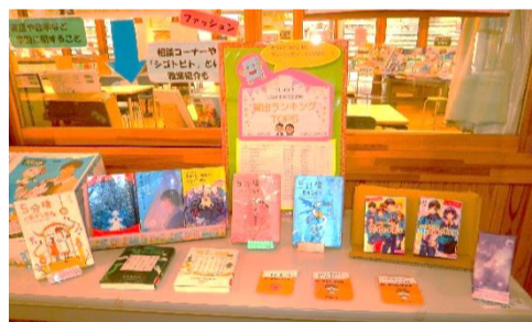
発表!! 三刀屋中学校図書館 貸出ランキングTOP5