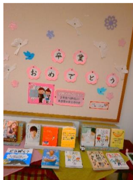
卒業生へ贈りたい1冊