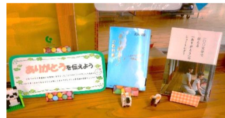
3月は別れの季節 ありがとうを伝えよう