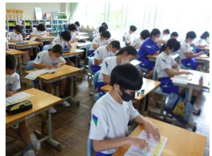
朝活動(漢字ドリル)の様子(6年生)

先日、子どもの朝の家での生活について興味深い調査を見つけました。「朝活」といって、朝の時間を利用して趣味や自己啓発など普段できない活動をするということについてです。よくある活動として、読書やジョギング、勉強などがあり、取り組んだ内容によって、健康維持ができたたり知識を増やせたり、生活リズムが整ったりとさまざまなメリットがあります。さらに、 子どもの頃に朝活をよく行っていた人ほど、大人になってからの資質・能力が高い傾向がある という調査結果も出ているようです(下図参照)。