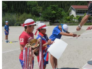
表彰式 よくがんばりました