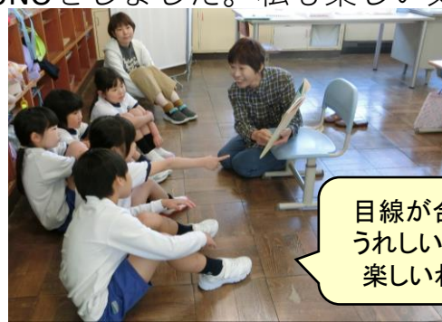
目線が合うと うれしいね！ 楽しいね！

例えば、1年生が楽しそうにブランコをしている時、隣のブランコに乗り、楽しい気持ちに共感しながら会話をしたことがありました。後日、保護者の方が「大切に気にかけてもらい安心感でいっぱいです」と言ってくださいました。また、別の日、けがのため外で遊べない子どもが昼休みをどう過ごしているんだろう（寂しい思いをしていないだろうか）と校舎内を回って見たら、教室で友だちとUNOをしていました。さりげない配慮ができる友だちがいることに感心しました。私も地べたに座って3人でUNOをしました。私も楽しい気持ちや寂しい気持ちを察知して、少しでも寄り添えるようになりたいなと思います。（この点、田井小の教職員は素晴らしいスキルと感覚で、しっかりと子どもに寄り添えています。）