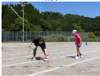
親子DEびよんきちリレー