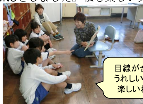
目線が合うとうれしいね！ 楽しいね！

例えば、1年生が楽しそうにブランコをしている時、隣のブランコに乗り、楽しい気持ちに共感しながら会話をしたことがありました。後日、保護者の方が「大切に気にかけてもらい安心感でいっぱいです」と言ってくださいました。また、別の日、けがのため外で遊べない子どもが昼休みをどう過ごしているんだろう（寂しい思いをしていないだろうか）と校舎内を回って見たら、教室で友だちとUNOをしていました。さりげない配慮ができる友だちがいることに感心しました。私も地べたに座って3人でUNOをしました。私も楽しい気持ちや寂しい気持ちを察知して、少しでも寄り添えるようになりたいなと思います。（この点、田井小の教職員は素晴らしいスキルと感覚で、しっかりと子どもに寄り添えています。）