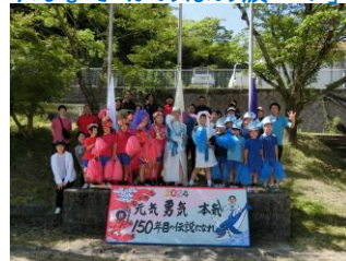
心と心のふれあい、素敵でした

この運動会が大成功であった原動力は、子どもたちのがんばりに尽きます！一人ひとりがひた向きに全力で取り組もうとする姿に感動しました！素晴らしかったです！不思議なことに、15人という小さな学校であることを忘れる瞬間が何度もありました。それくらい、一人ひとりの存在感が際立っていた&輝いていたからだと思います。工夫と努力で様々な苦労や苦難を乗り越えた高学年のリーダーシップ、それに導かれて協力の力を高めた1～4年生のフォロワーシップ、どちらも自分自身の大きな成長につながったと確信しています。