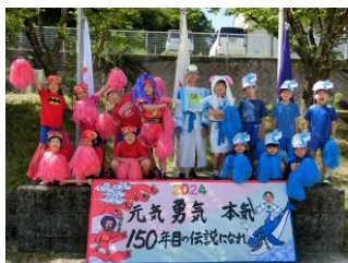
入場行進前のひとコマ

1・2年生はテント周りの飾りを、3・4年生はスローガン看板を、5・6年生は運動会全般に関わる計画や原案作成など、全校みんなで創りあげるのが田井小の運動会です。