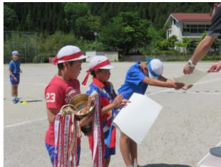
表彰式 よくがんばりました