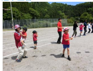
全校・親子ダンス