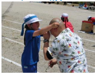
児童種目「摩訶不思議アドベンチャー」