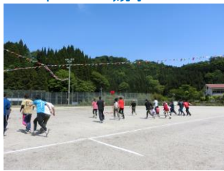
保護者種目ダンシング玉入れ