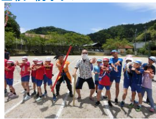
みんなで「かめはめ波ー！」