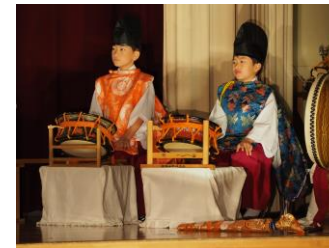
「みんなで息を合わせて作り上げた田井っ子神楽」