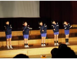
「『5つ星チャンネル』で田井の魅力を発信しよう」

各学年部ではこの記念すべき発表会に向け、声の出し方やせりふの言い回し、ダンスや細かい動作など、日々の練習の中で努力と工夫を重ねて表現することに挑戦してきました。それらの様子を写真と共に紹介します。