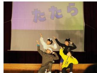
「キレイキレイのたたらダンス」