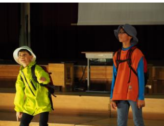
「田井にやってきた旅人が注文の多い料理店に入ると…」