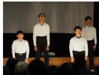
「美しいハーモニー」

各学年部の発表に共通した特徴のひとつが、地域の数多くの皆様に協力していただいた学習をもとにしていることです。みなさまから「感動した!」「1人ひとりが輝いていた!」「素晴らしい子どもたち、素晴らしい先生たち!」など、多くのお褒めの言葉をいただきました。