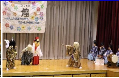
深野神楽「八俣大蛇」(ヤマタノオロチ)