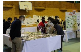
(思ひで写真館の様子)