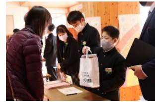
(受付でおもてなし)