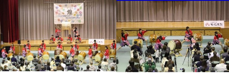
火焰太鼓「清流」「三宅」